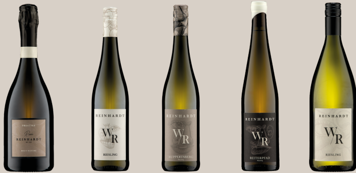
SEKT GUTSWEIN ORTSWEIN LAGENWEIN BASIS